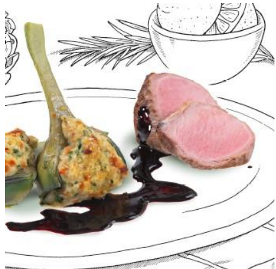
Schweinefilet mit Speck umwickelt und kleine gefüllte Artischocken