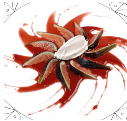
Feigen in Himbeeressigkaramell mit Ziegenfrischkäse

Die Adresse im Betreff der Überweisung notieren und ggf. auch einen Text, den Peter Schmitt dann für Sie persönlich hineinschreiben kann, vermerken.